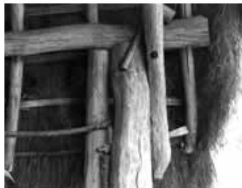
Détail d'assemblage de la loge du Haut-Davy.

Les matériaux employés à la confection des loges étaient autrefois exclusivement végétaux. La structure porteuse était réalisée à l'aide de poteaux et de perches de châtaignier. La couverture, quant à elle, était faite généralement de bruyère mâle, nommée « brémale », « bromole », « brande », ou encore « cerveline », récoltée dans les landes et les sous-bois. Mais il existait aussi des couvertures en paille, en roseau, ou « bourre », ou encore en chaume.