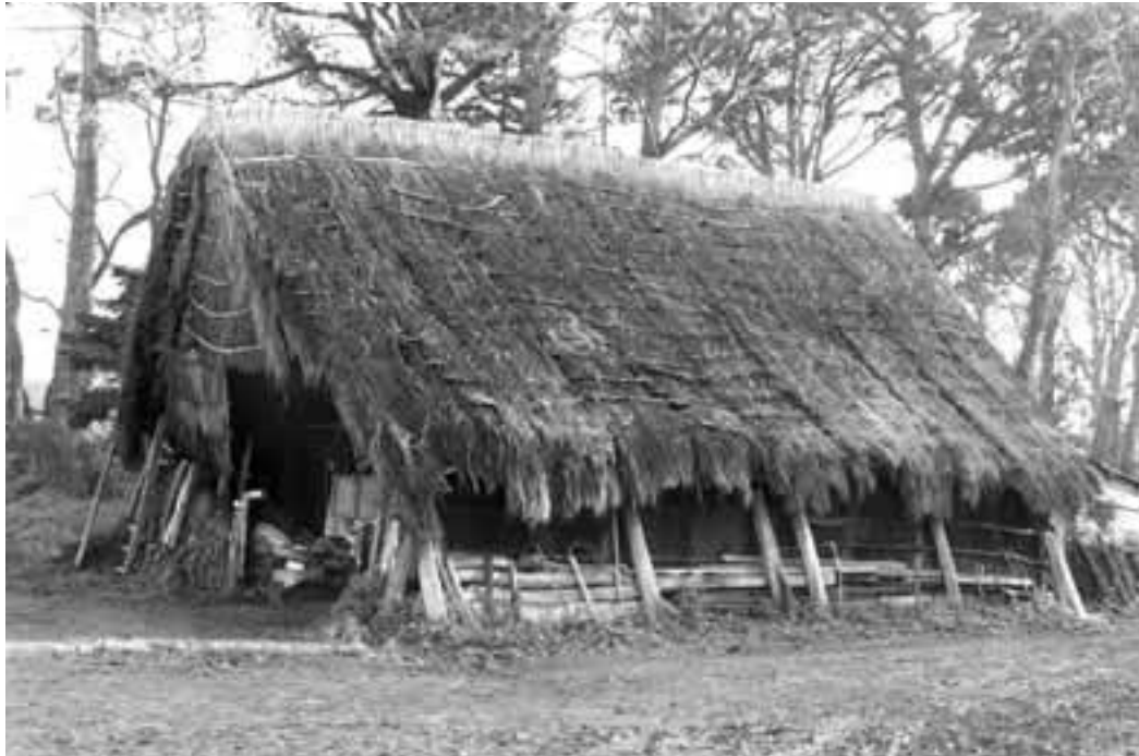
Loge du Coudray-Monbault.

En Anjou, les loges, généralement de plan rectangulaire, présentent deux morphologies principales : soit elles comportent deux pignons ou bien une croupe à l'arrière et une demi-croupe à l'avant. L'entrée se situe toujours au pignon, où elle peut être protégée éventuellement par l'avancée de la demi-croupe.