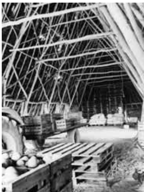
Vue intérieure de la loge du Haut-Davy.

Héritières d'une longue tradition les rattachant peut-être à l'habitat protohistorique, les loges furent inlassablement bâties et rebâties par les paysans angevins qui avaient besoin de ces abris précaires et économiques.