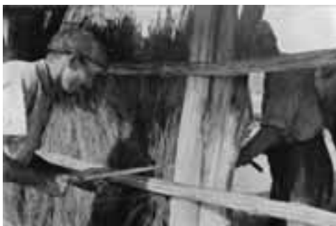
Technique de fixation de la couverture sur la structure en bois (Photographie par Stemmermann, 1942).

En Anjou, les loges, généralement de plan rectangulaire, présentent deux morphologies principales : soit elles comportent deux pignons ou bien une croupe à l'arrière et une demi-croupe à l'avant. L'entrée se situe toujours au pignon, où elle peut être protégée éventuellement par l'avancée de la demi-croupe.