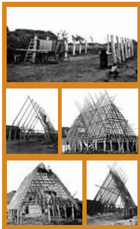
Étapes de construction d'une loge (Photographies par Stemmermann, 1942).

Ce bâti étant mis en place, d'autres bois sont posés verticalement et horizontalement créant une sorte de lattis à maillage serré, sur lequel sera posé le matériau de couverture. Ce dernier est constitué de branches de bruyère liées pour former des sortes de balais que l'on attache par rangs